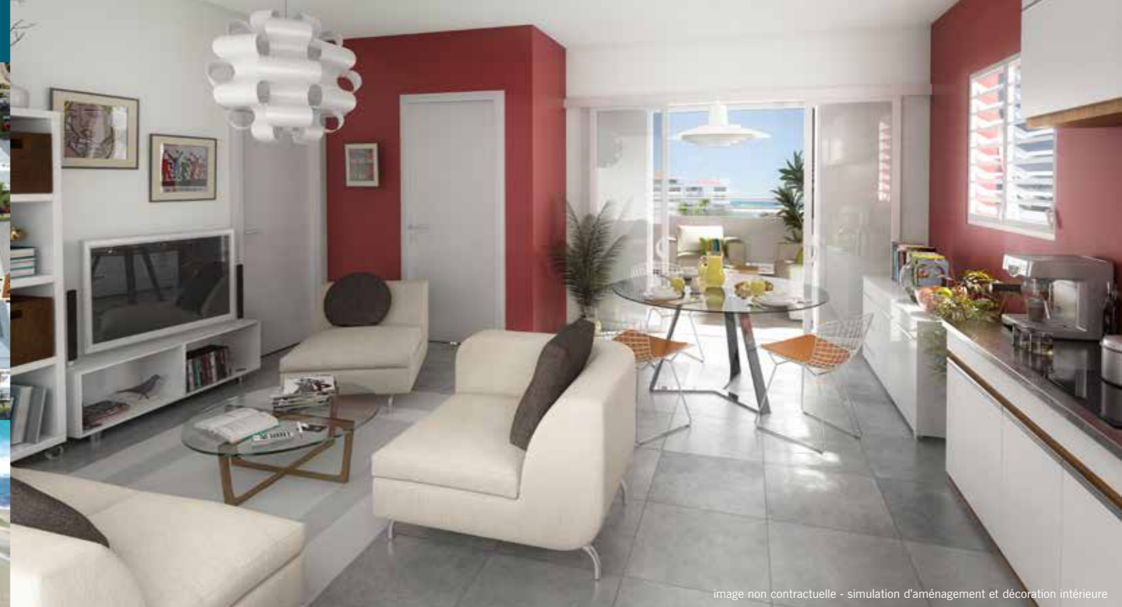
image non contractuelle - simulation d'aménagement et décoration intérieure